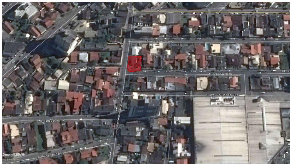
LOCALIZAÇÃO S/ ESCALA